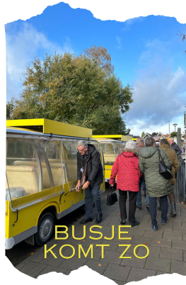
BUSJE KOMT ZO